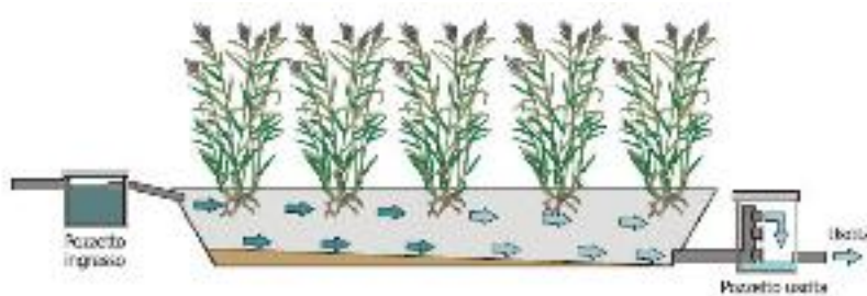
Fitodepurazione – SFS-h